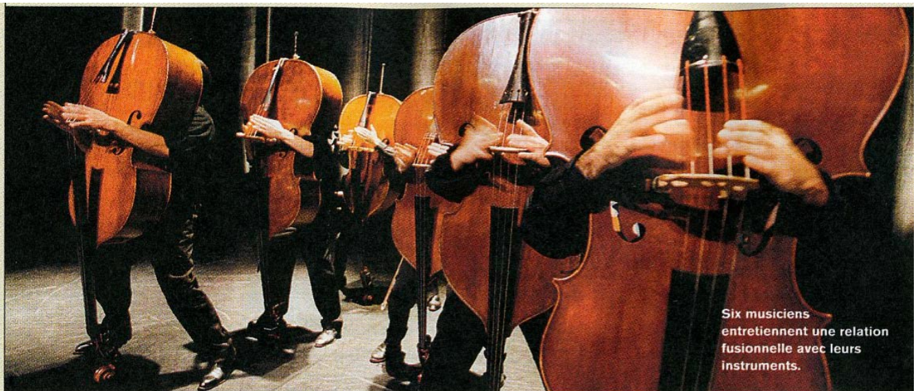
Six musiciens entretiennent une relation fusionnelle avec leurs instruments.